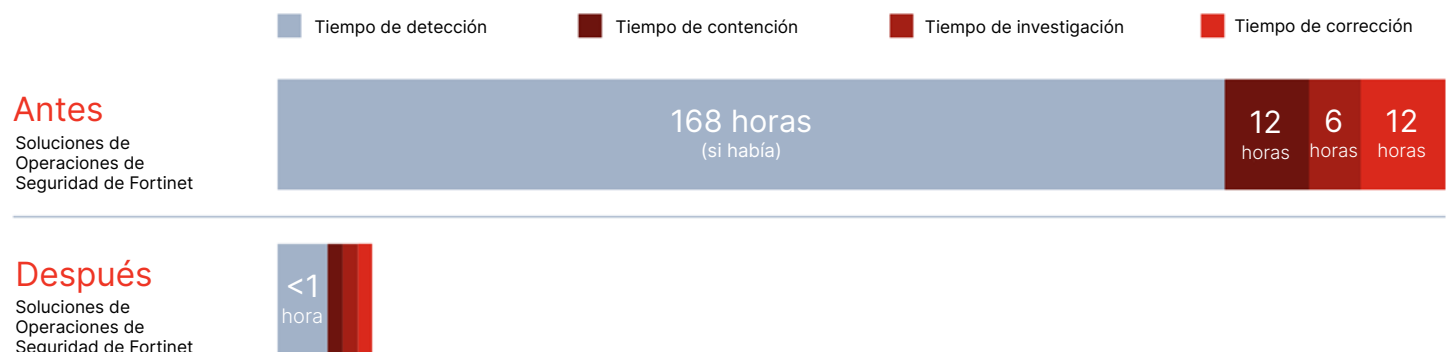
Figura 3: Ventajas cuantificadas de la implementación de los componentes de Operaciones de Seguridad de Fortinet