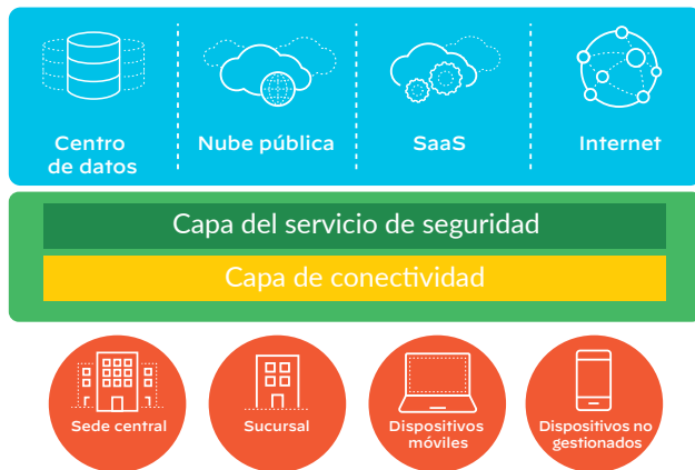
Figura 3: Protección basada en la nube para todos los usuarios, estén donde estén

Prisma Access conecta las aplicaciones alojadas en distintas ubicaciones a través de su capa de conectividad para que los usuarios tengan acceso a cualquier aplicación, ya esté en la nube o en el centro de datos. La capa de conectividad se ocupa de garantizar un acceso seguro (mediante políticas basadas en las tecnologías App-ID™ y User-ID™) a la nube pública, el software como servicio y las aplicaciones del centro de datos.